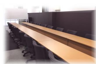
対面形式 16 名