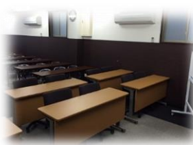
スクール形式 30 名