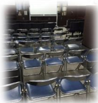
シアター形式 50 名